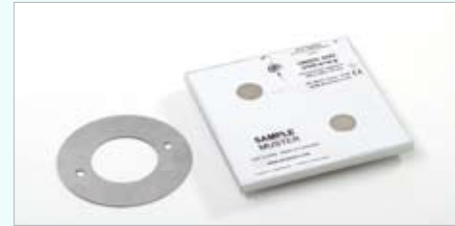
Magnethalterungen mit Haftblechen zur Wandbefestigung