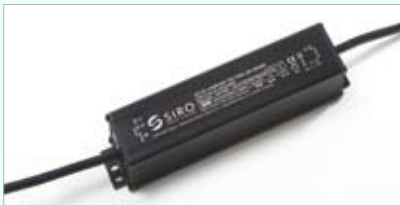
L x B x H / 196 x 40,2 x 34 mm indoor / outdoor IP 67 output voltage 24 VDC input voltage 90 - 264 60 Watt