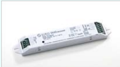
L x B x H / 150 x 30 x 20 mm 868 MHz Radio Frequency Sender pro Receiver bis zu 8 Controller anlernbar dadurch einfache Gruppierung von Leuchten 24 VDC / 2x 72 W ( 144 W )