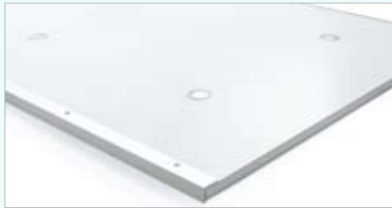
Rückseitige Ansicht Rahmen und Magnethalterungen