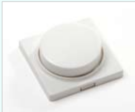
Funk Controller - Dimmer, Fernbedienung und Farbtemperaturregler L x B x H / 50 x 50 x 20mm 868 MHz Radio-Frequenz Sender bis zu 100 Receiver - in Reichweite steuerbar Reichweite ca . 30 - 40 m funktioniert auch durch Wände